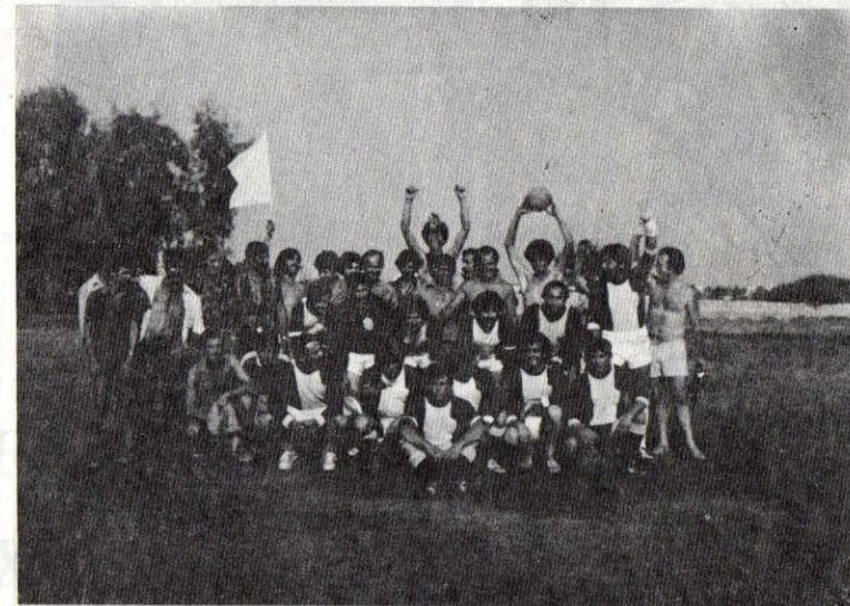
Μετά τόν άγώνα του Κυπαρισσιού

—'Αν κάποιος Αύγουστιάτικο απόγευμα τύχει και πάρεις τό δρόμο για τό σχολείο από μακριά κιόλας θά σε υποδεχτή ένα ζωηρό ξεφωνητό πλουτισμένο μέ χαρά, άγωνία και πάθος. Καί πλησιάζοντας μέ μεγάλη σου έκπληξη θά δεις ένα πολύβουο μελισσολόι πιστικιάδων να τρέχει προς τή μάλλα, να κλωτσάει, να πασχίζει, να άγωνιά για τό πιος θά κερδίση τή μάλλα ποιός θά πετύχη τό γκόλ. Καί στό τέλος ή κούραση και ή χαρά άνακατεμένη μέ τόν ιδρώτα τών μικρών παιδιών που πάλεψαν ένα όλόκληρο απόγευμα συνθέτουν όλο τό μεγαλείο τής άθλούμενης νεολαίας.