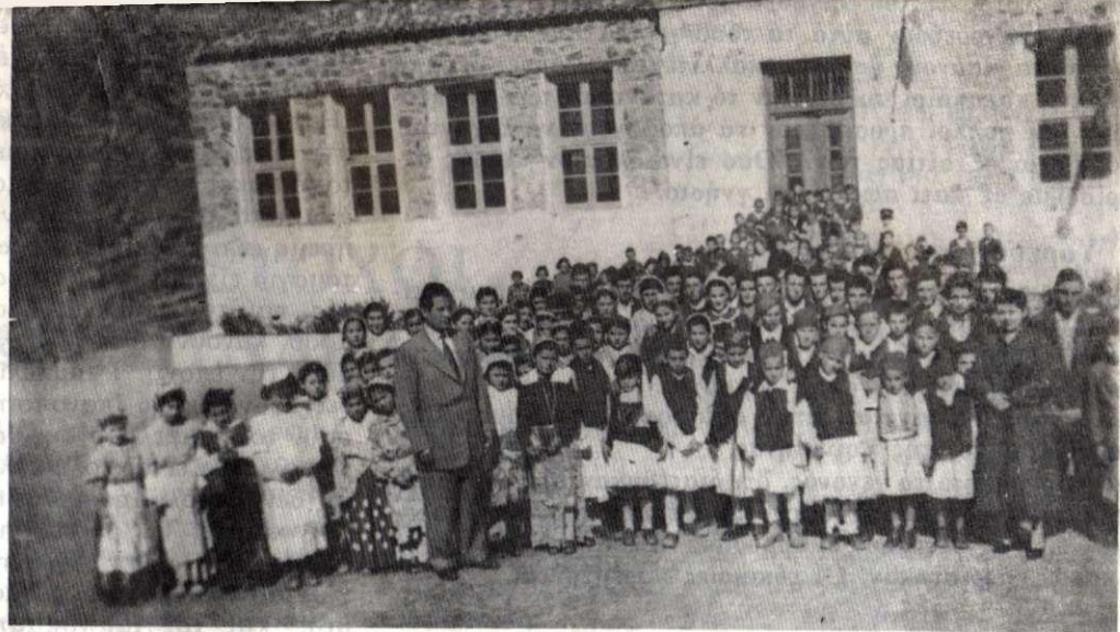
Γιορτὴ στὸ Σχολεῖο Κρεμαστῆς 1953

Στὰ κρεμαστιώτικα πλαίσια οἱ ἄρχοντες διακρίνονται σὲ δύο κατηγορίες, στοὺς διορισμένους καὶ στοὺς ἐκλεγμένους. Οἱ διορισμένοι ἄρχοντες εἶναι ὄργανα τῆς πολιτείας πού σκοπὸ ἔχουν νὰ ἐξυπηρετοῦν τοὺς Κρεμαστιώτες σὲ συγκεκριμένους κρατικούς τομεῖς. Τέτοιοι εἶναι ὁ Δάσκαλος, ὁ Γραμματικός, ὁ Τηλεφωνητῆς, ὁ Ἀνταποκριτῆς τοῦ ΟΓΑ, ὁ Ἀγροτικός Γιατρός, ὁ Ἀγροφύλακας, ὁ Παππᾶς καὶ ὁ Ταχυδρόμος. Στὸ χωριό μας ἀπὸ παλιά ὑπάρχει μιά παράδοση συνεργασίας μεταξύ ὄλων τῶν πλιό πάνω καὶ τῶν