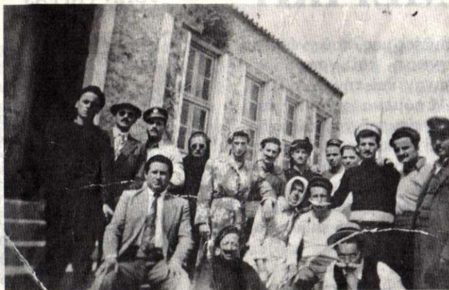
Τό Κρεμαστιώτικο Θέατρο τοῦ 1953