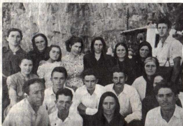
Ἐκδρομή Κρεμαστιωτῶν στήν Ἐλωνα 1953