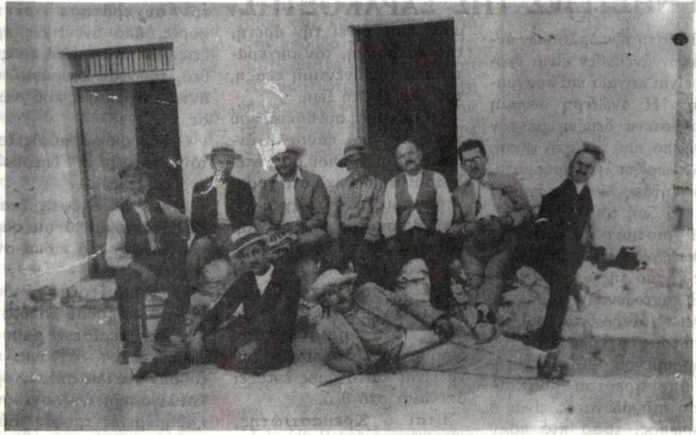
Κρεμασιῶτικη παρέα τοῦ 1942.