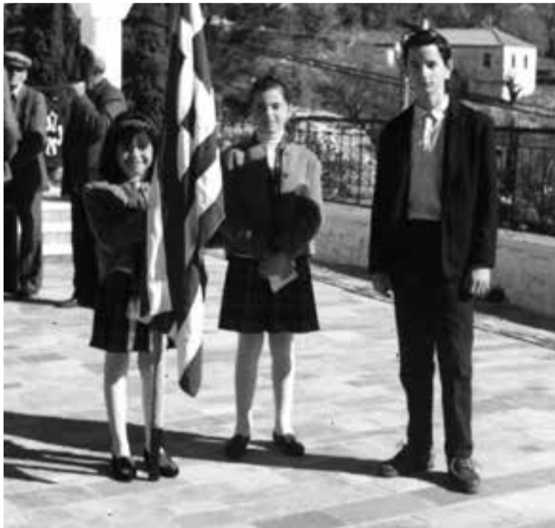
Όταν το σχολείο λειτουργούσε... Οι δύο μαθήτριες παρίστανται στην κατάθεση στεφάνου για την 28η Οκτωβρίου.

ΣΤΙΣ 14 & 15 Αυγούστου η εκκλησία είχε τον πρωταγωνιστικό ρόλο της. Ακούραστος ο αγαπητός μας παπα-Γιώργης με τη μελωδική φωνή του και με τη βοήθεια των ψαλτών ετέλεσε υποδειγματικά τις προβλεπόμενες ακολουθίες