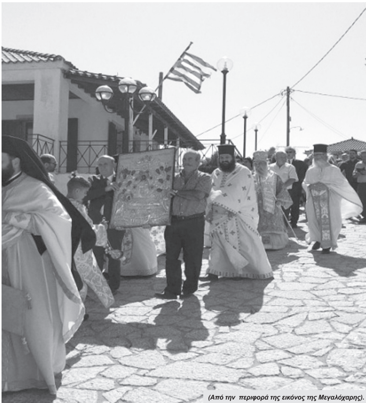
(Από την περιφορά της εικόνας της Μεγαλόχαρης).

Ακούουθησε η Μεταμόρφωση του Σωτήρος. Γέμισε ασφυκτικά, μέσα και έξω ο Άγιος Κωνσταντίνος. Το έθιμο της ψαροφαγίας το τήρησαν αρκετοί και η μυρωδιά από