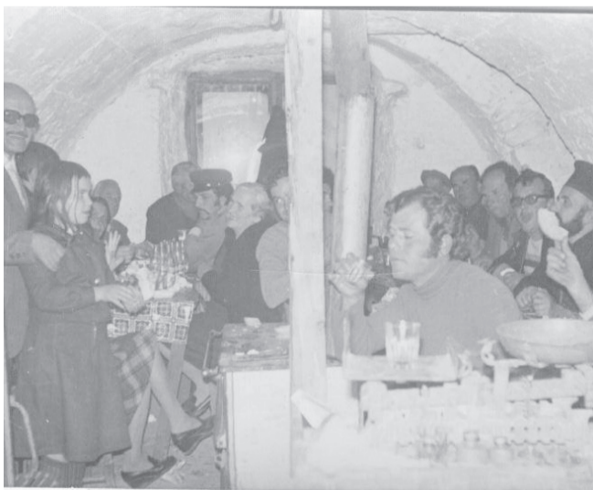
(Μετά την απόλυση της Θείας Λειτουργίας των Χριστουγέννων, κάποτε...).