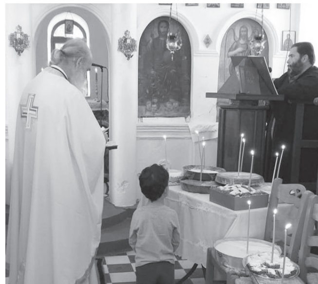
(Τιμώντας τη μνήμη του Αγίου Φανουρίου στον Αη Νικόλα).