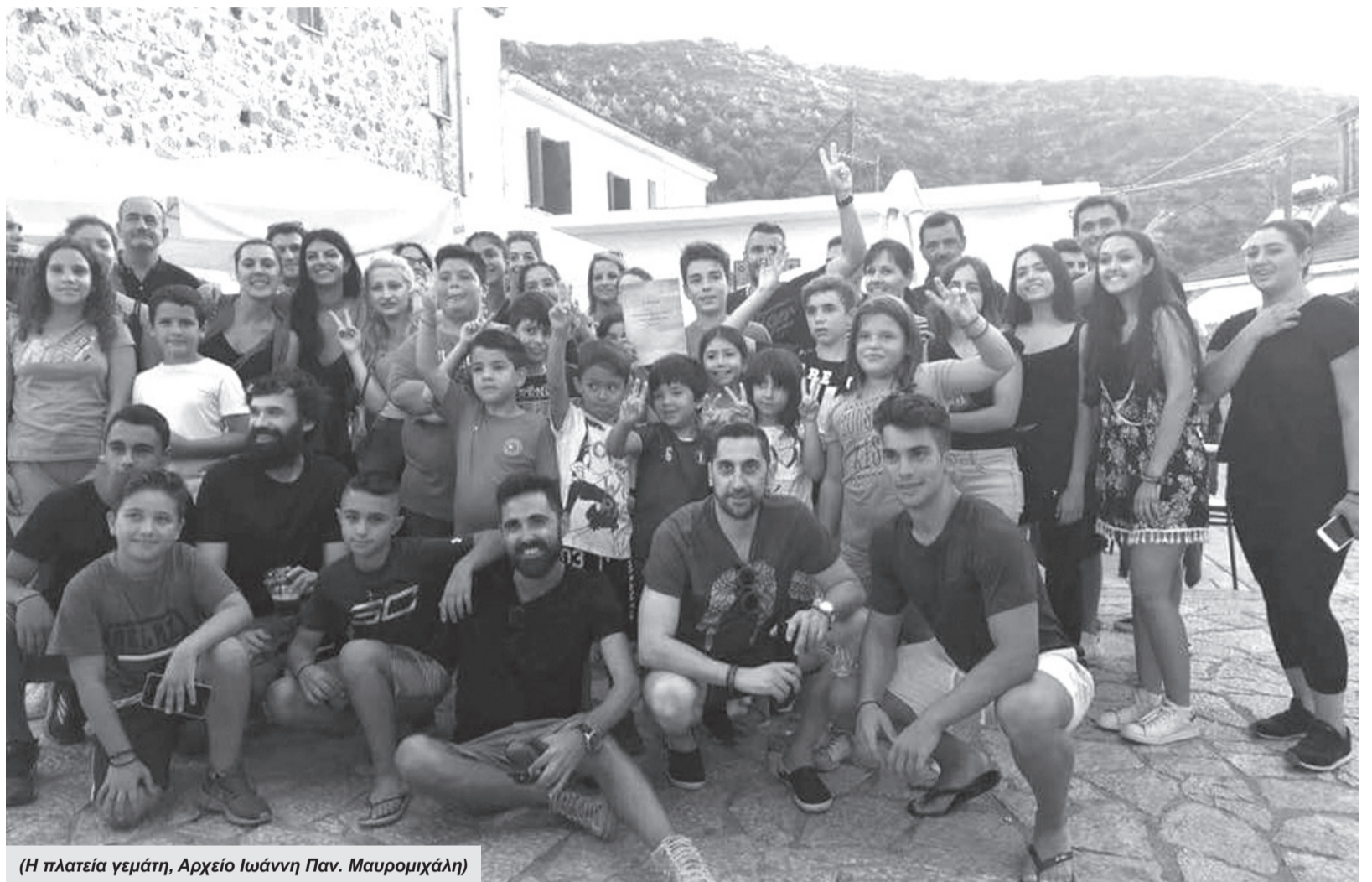
(Η πλατεία γεμάτη,)