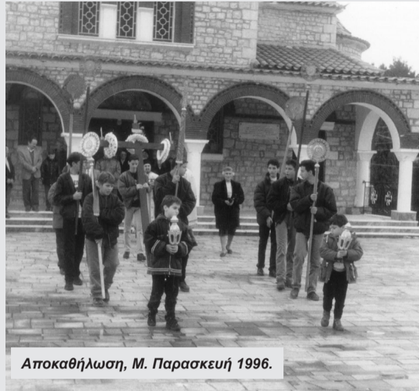
Αποκαθήλωση, Μ. Παρασκευή 1996.

Μετά από λίγες ώρες, ακολουθεί η τέλεση του όρθρου του Μ. Σαββάτου στον Ι. Ν. του Αγίου Κωνσταντίνου. Περί το μέσον της ακολουθίας, ψάλλονται τα Εγκώμια του Επιταφίου Θρήνου από το λειτουργό ιερέα και δύο χορωδίες, από τις οποίες η μία αποτελείται από άνδρες και η άλλη από γυναίκες. Στη συνέχεια, ακολουθεί η περιφορά του Επιταφίου στους δρόμους του χωριού. Η πομπή κάνει στάση στον ΙΝ της Παναγίας, όπου οι πιστοί προσκυνούν τον Επιτάφιο, διαβάζονται οι περικοπές από τα βιβλία του Ιεζεκιήλ, του Απόστολου και του Ευαγγελίου, και στη συνέχεια, η πομπή συνεχίζει την πορεία της επιστροφής στον Άγιο Κωνσταντίνο, όπου εναποτίθεται ο Επιτάφιος