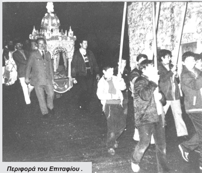
Περιφορά του Επιταφίου .