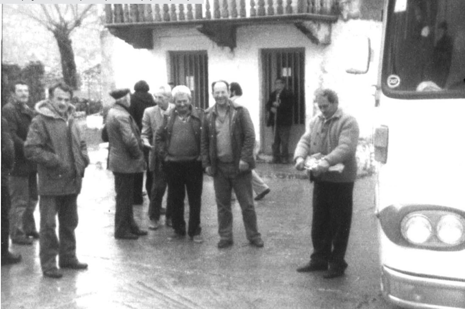
Απόκριες 1978, Το πούλμαν έτοιμο να επιστρέψει στην Αθήνα.

Ο υπογράφων αρθρογράφος φέρει την ευθύνη για το περιεχόμενο του άρθρου του. Ετήσια Συνδρομή: 20,00€