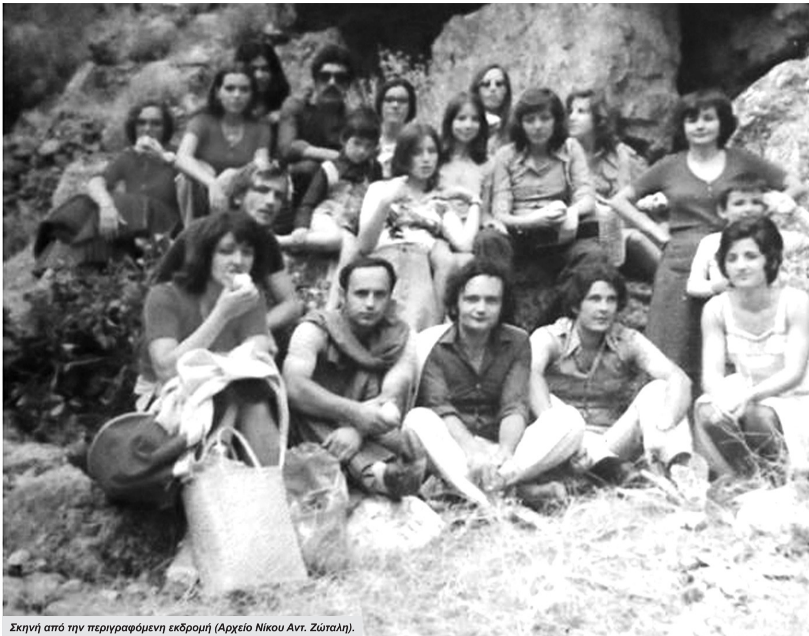
Σκηνή από την περιγραφόμενη εκδρομή.

Τη διαδρομή αυτή την είχα κάνει μία φορά μικρός που ήμουνα στο κτήμα στο Μαρί δραγάτης και περιβολάρης και είχε χαραχτεί η ομορφιά της έντονα στη μνήμη μου. Με ένα ταγάρι η τράστο με το οποίο μετέφερα κάποια πράγματα έκανα τη διαδρομή και αναγκάστηκα κάποιες φορές να το κρεμάσω στο λαιμό ώστε να έχω τα χέρια μου ελεύθερα. Η ιδέα μας έγινε δεκτή με μεγάλο ενθουσιασμό από όλη την παρέα. "Έτσι προχωρήσαμε στην οργάνωση μιας εκδρομής πορείας. Αποκλείσαμε τους άντρες τους μεγαλύτερους από μας βασικά επειδή