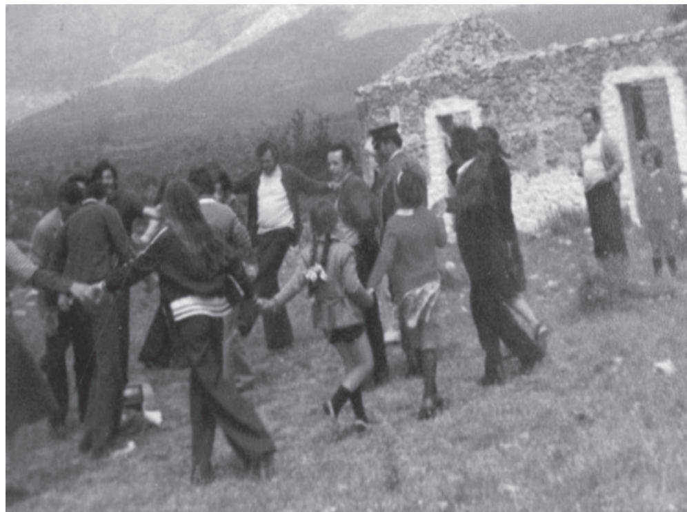
Τα δημοτικά τραγούδια συνόδευαν τις περισσότερες φορές το χορό και το γλέντι.

Μ ου προσφέρθηκε πρόσφατα ως δώρο μια συλλογή δημοτικών τραγουδιών των Λαγκαδιών της Γορτυνίας που επιμελήθηκε η Λαγκαδιανή, Μαρία Πισιμίση-Κατσικά με τίτλο «Λαγκάδια Αρκαδίας-Δημοτικά Τραγούδια και Μοιρολόγια», που κυκλοφορεί από τις Εκδόσεις Λιβάνη.